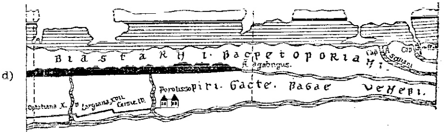
Tabula Peutingeriana, fragment reprezentând Dacia. Dacia auf die Tabula Peutingeriana